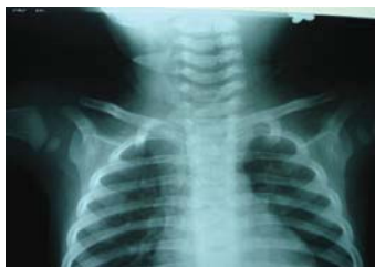
تصویر شماره ۱- تصویر رادیوگرافی قفسه سینه ضایعه لوسنت در قسمت تحتانی گردن را نشان می‌دهد.

غربال‌گری برای ارزیابی گسترش داخل شکمی به کار رفته و ازوفاگوگرام نیز می‌تواند در تشخیص کمک کننده باشد [۲]. مطالعات تشخیصی در بیمار حاضر گرافی قفسه سینه، گرافی لترال گردن و سی‌تی اسکن گردن و قفسه سینه بود. دوپلیکاسیون مری ممکن است با آنومالی‌های زیر همراه باشد: دوپلیکاسیون روده باریک؛ آترزی مری دیستال به دوپلیکاسیون؛ فیستول تراکتوازو-فاژیال؛ آنومالی‌های ستون فقرات (در ۲۰ تا ۵۰ درصد موارد) مثل اسکولیوز، همی‌ورترا، چسبندگی مهره و اسپینایفیدای قدامی [۷،۶]. به دلیل رشد سفالیک نوتوکورد و رشد کودال فورگات ضایعات مهره‌ای همراه اساسا بالاتر از کیست مدیاستن هستند [۷]. معمولا این کیست‌ها به‌طور اتفاقی در گرافی قفسه سینه در بیماران بدون علامت پیدا می‌شوند [۶] و در دوسوم موارد سرانجام دچار علامت شده و معمولا وقتی دچار عارضه عفونت، جابه‌جایی و فشار روی ارگان‌های مجاور، خون‌ریزی، پارگی یا نئوپلاسم شوند با علائم انسداد راه هوایی یا مری تظاهر می‌کنند [۷،۶]. بیماران مبتلا به کیست دوپلیکاسیون مری گردنی در شیرخوارگی به‌طور شایع با دیسترس تنفسی تظاهر می‌کنند و حتی ممکن است بروز این علائم قبل از ظهور توده باشد. این بیماران ممکن است با مشکل در تغذیه تظاهر کرده که به‌علت رشد سریع کیست ثانویه به عفونت، خون‌ریزی یا ترشح در داخل کیست است. تشخیص افتراقی کیست‌های گردن شامل مالفورماسیون‌های لنفاتیک، کیست‌های راه هوایی یا برونکیال یا تیروگلووسال است [۳]. درمان ارجح تخلیه کامل کیست بوده و پروگنوز آن عالی است و اگر تخلیه کامل آن ممکن نیست، باید حداقل مخاط کیست برداشته شده تا کیست به‌تدریج تحلیل رود [۸،۷،۳].