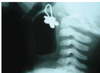
تصویر شماره ۲- گرافی لترال گردن ضایعه کیستیک با سطح مایع، هوا در خلف مری و تراشه را نشان می‌دهد.

ضایعه‌ای کیستیک در گردن مشکوک می‌شود (تصویر شماره ۱). از بیمار گرافی لترال گردن گرفته شده و ضایعه کیستیک با سطح مایع هوا در خلف مری گردنی دیده شد و مشخص گردید که این ضایعه سبب انحراف تراشه و مری به ناحیه قدامی گردن شده است (تصویر شماره ۲). در تصاویر سی‌تی اسکن گردن و قفسه سینه مشاهده شد که ضایعه به میان سینه خلفی انتشار یافته و به‌نظر می‌رسید با راه هوایی ارتباط دارد (تصویر شماره ۳). نتایج مربوط به آزمایشات خونی بیمار طبیعی بود. با توجه به محل کیست و درگیری میان سینه و نیز پرمخاطره بودن اسپیراسیون تصمیم به عمل جراحی گرفته شد و بیمار با برش مایل سمت چپ گردن تحت عمل جراحی قرار گرفت. به‌هنگام جراحی مشخص شد که کیست با مری ارتباط داشته و پس از قطع ارتباط مری ترمیم شد. ضایعه به‌صورت ناکامل برداشته شده و پس از حذف مخاط باقیمانده کیست، درناژ گردن انجام شد. در نهایت لوله گاسترو-ستومی برای بیمار گذاشته شد. بیمار دو هفته پس از بستری با حال عمومی خوب ترخیص شد. در هیستوپاتولوژی کیست (شکل شماره ۴)، دوپلیکاسیون مری با مخاط اسکواموس مری گزارش گردید. در پی‌گیری بیمار و معاینات انجام شده در هفته اول، دوم و یک‌ماه بعد بیمار شکایت خاصی نداشته و عوارض جراحی مشاهده نشد.