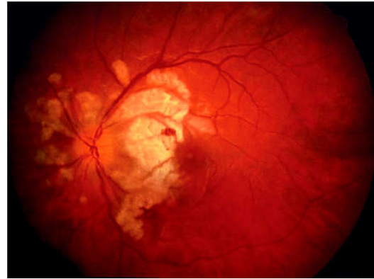
تصویر ۳- تصویر فوندوس چشم چپ بیمار با از دست دادن شدید و دوطرفه بینایی که بلافاصله پس از تولد روی داده است.

بروز کند، رخ داده است. هرچند آمبولی مایع آمنیوتیک نیز می‌تواند آرتریول‌های شبکیه را مسدود نماید. این حالت بسیار نادر و به طور معمول کشنده می‌باشد.