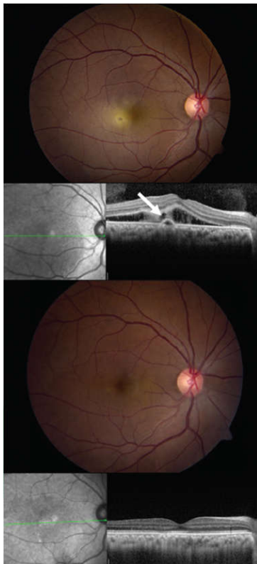
تصویر ۴- تصویر فوندوس (بالا) و OCT (پایین) از چشم راست در چشم یک خانم باردار در اواخر سه ماهه دوم حاملگی با رسوب ساب‌رتینال پیشرونده و حدت بینایی ۲۰/۶۰

مواردی که فیبرین در فووه‌آ یا نزدیک آن وجود ندارد و بیمار به انتهای بارداری نزدیک می‌شود، بیمار را تحت‌نظر گرفت و انتظار داشت پس از زایمان بهبودی رخ دهد. برای بیمارانی که فووه‌آ به واسطه فیبرین در خطر است منطقی است که فوتوکواگولاسیون حرارتی با لیزر مدنظر قرار گیرد که این درمان با هدایت معاینات فوندوس و تصویربرداری OCT در بارداری انجام می‌شود (تصویر ۴).