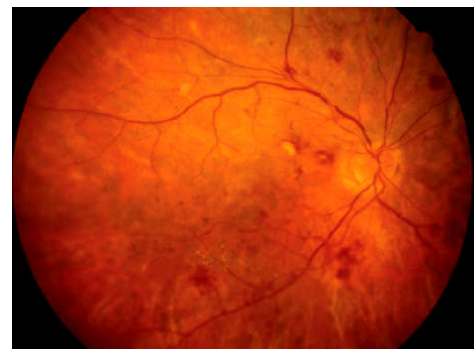
تصویر ۱- تصویر رنگی فوندوس در یک بیمار با فشارخون ناشی از بارداری

در صورت مشاهده نشانه‌ها و علایم رتینوپاتی حاد ناشی از فشارخون در معاینه ته چشم باید بلافاصله به ارجاع بیمار برای ارزیابی و درمان سندرم‌های فشارخون بارداری یعنی پره‌اکلامپسی