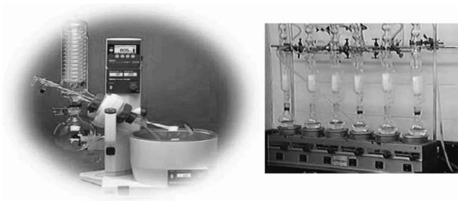
شکل شماره ۴- دستگاه سوکسله شش خانه شکل شماره ۵- دستگاه تقطیر در خلاء گردش