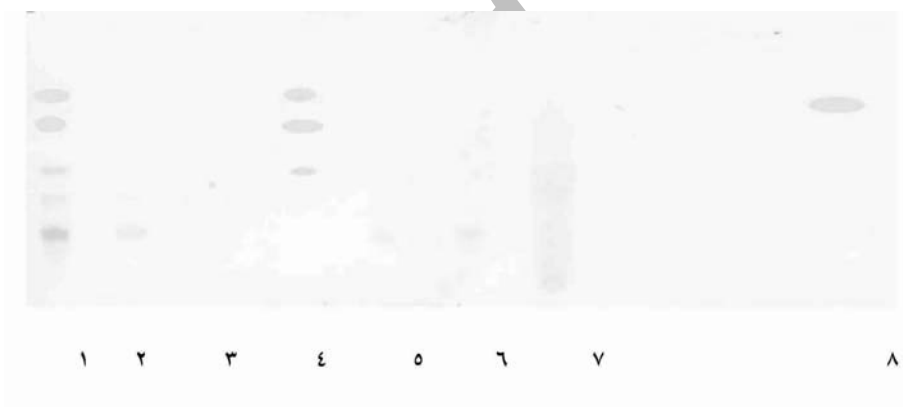
شکل شماره ۶- کروماتوگرام ترکیبهای رنگی زعفران روی TLC