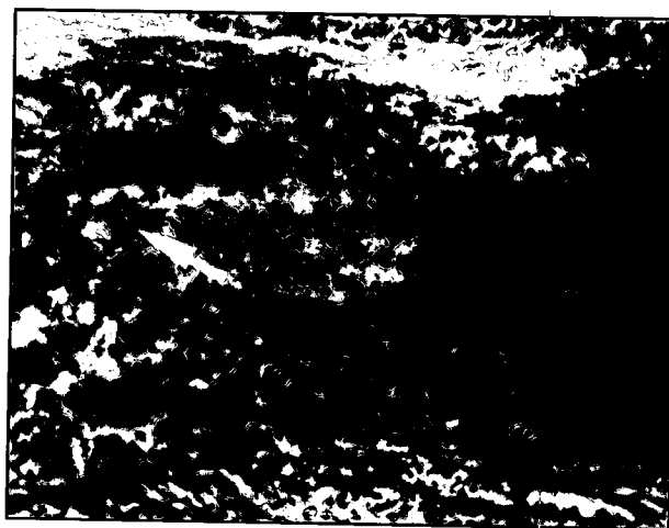
تصویر ۱- پرولیفراسیون سلولهای توموری با منشا اپیدرمی به صورت نامنظم و واکنله شدن سلولهای مذکور مشاهده می شود.