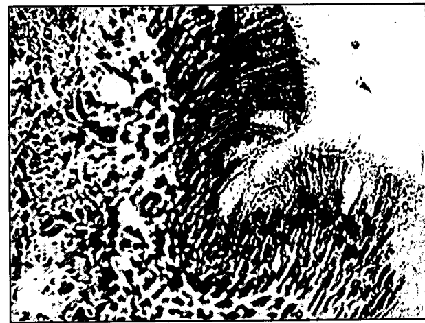
تصویر ۳- بافت پوششی استوانه ای مطابق کاذب مزه دار حاوی سلولهای جامی شکل در دیواره جانبی لومن عضو و مروزال. رنگ آمیزی H&E. درشت نمایی ۴۰x.

آن ارایه شده است (۲۰۷، ۱۲). در یک بررسی که با تصویربرداری از VNO انسانها به روش ("MRI" Magnetic Resonance Imaging) همراه بود نشان دادند که مجرای عضو به صورت یک ساختمان لوله ای شکل با میانگین طول ۷ میلی متر (از ۳ تا ۲۲ میلی متر) می باشد و از نظر شکل و اندازه و موقعیت عضو، در انسان دارای تفاوتی قابل ملاحظه ای است (۲).