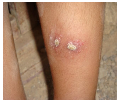
تصویر ۱- پیشرفت التیام ضایعات زخم‌های چندگانه لیشمانیوز جلدی در بیماران تحت درمان با داروی سنتی محلی حاوی عصاره پیاز (چپ) و

آمفوتریسین "ب" (راست) (ایلام؛ مهران، ۱۳۸۵)