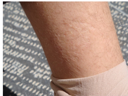
تصویر ۲- جوشگاه (اسکار) باقیمانده از لیشمانیوز جلدی بعد از معالجه با داروی سنتی محلی حاوی عصاره پیاز (ایلام؛ مهران، ۱۳۸۶)

یکی دیگر از مواردی که در بیماری لیشمانیوز همواره مورد توجه و سؤال بوده این است که آیا جنسیت بر میزان بروز و میانگین تعداد زخم‌های حاصله مؤثر