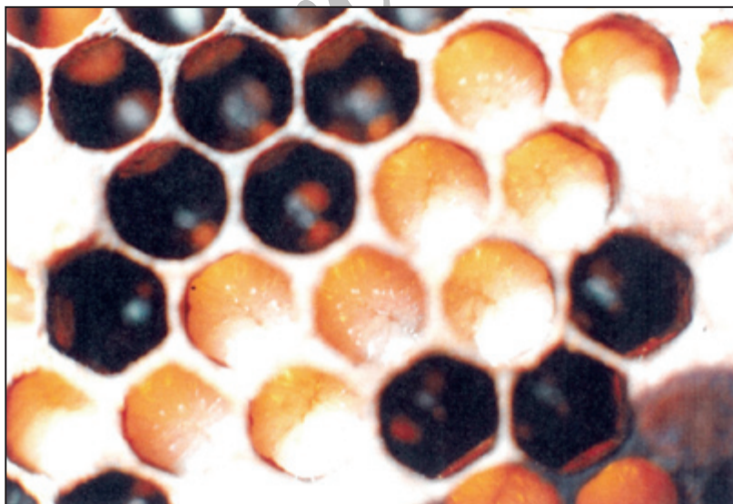
شکل ۲- محدوده در نظر گرفته شده شامل لاروهای سن آخر (عکس برداری از فاصله ۴ سانتیمتری)

سر بسته شدن سلول ها، قاب های مورد نظر از کندو خارج و عاری از زنبور گشتند و به انکوباتور بزرگ انتقال یافتند. در تمام طول آزمایش ها درجه حرارت انکوباتور 34 \pm 1 درجه سانتیگراد و رطوبت نسبی ۴۰ تا ۶۰ درصد تنظیم گردید. هر دو ساعت یکبار به قاب ها سر زده شد و تعداد سلول های باز شده و زمان دقیق باز شدن آنها یادداشت گردید و تا آخرین سلول ها ادامه یافت. زنبورهای متولد