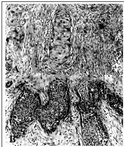
شکل ۲: تهاجم بافت نئوپلاستیک اسکوآموس سل کارسینوما به استرومای زیرین و لایه های عضلانی دیواره کیسه صفرا (بزرگنمایی ۲۰۰×)

درجه حرارت ۳۷/۲ درجه سانتیگراد، تعداد نبض ۹۰ تا در دقیقه، تعداد تنفس ۲۴ تا در دقیقه و فشار خون ۱۲۵/۷۵ میلیمتر جیوه داشت. بیمار در سابقه پزشکی خود بیماری فشار خون تحت درمان را دارد.