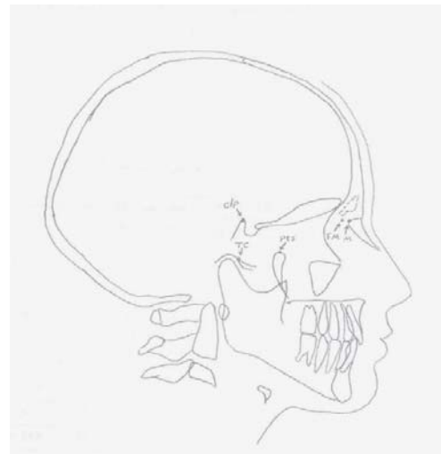
شکل ۱: محل شاخص های بررسی شده در مطالعه حاضر

سپس شاخصهای مشخص شده و نقاط مبدا به کاغذهای شطرنجی ۱×۱ میلی متری انتقال یافته و برای هر شاخص روی محور افقی Xها و محور عمودی Yها مختصات تعیین گردید. اطلاعات به کمک آزمون آماری t-test و نرم افزار SPSS (Version 9.01) مورد تجزیه و تحلیل آماری قرار گرفت و میزان خطای تعیین نقاط سفالومتریکی در یک مشاهده گر و بین مشاهده گران بررسی گردید.