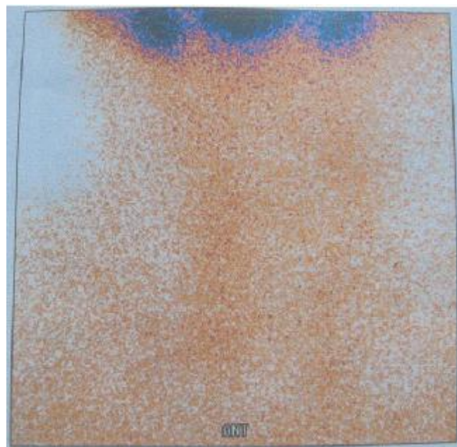
شکل ۲: جذب ید رادیواکتیو در ناحیه تیروئید زبانی در نمای قدامی و عدم جذب ماده رادیواکتیو در محل طبیعی غده تیروئید