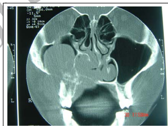
شکل شماره ۳- سی تی اسکن - مقطع کرونال؛ به وجود یک توده در سینوس ماگزیلاری راست با انتشار به سپتوم بینی و انسداد حفره بینی همان طرف و گسترش تومور به کف سینوس ماگزیلاری و نسج قدامی صورت توجه شود.

با توجه به گسترش وسیع تومور و تخریب استخوانی، با انسوزیون کالدول دوک، قسمتی از توده جهت بیوپسی به صورت لوکال خارج شد. در گزارش میکروسکوپی و بررسی‌های ایمنوهیستوشیمیایی، لنفوم Undifferentiated B-cell type گزارش شد. بعد از تایید تشخیص، بیمار تحت درمان رادیوکموترابی قرار گرفت.