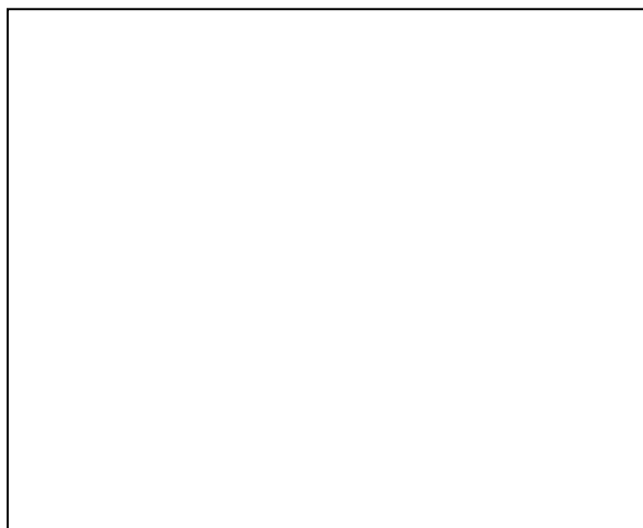
تصویر شماره ۱- لام مغز استخوان با درشت‌نمایی ۴۰ که گامتوسیت مالاریای فالسی پاروم دیده می‌شود.

نکته مهم در مورد این بیمار آن است که تصور می‌شد برخی از علائم مشاهده شده به علت اعتیاد و محرومیت از مواد مخدر می‌باشد و به علت عدم وجود سابقه مسافرت به مناطقی که ابتلا به مالاریا در آن‌ها شایع است، این بیماری جزء تشخیص‌های افتراقی اولیه قرار نگرفت.