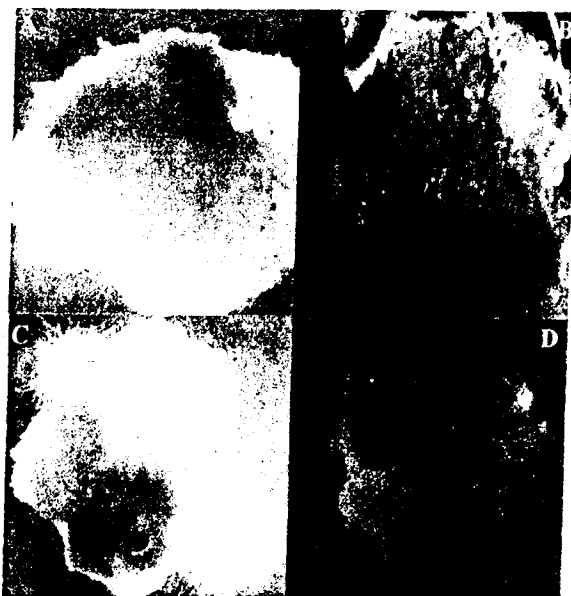
شکل ۲- انواع پاسخهای متفاوت کشت پینه در محیط تمایزبایی

میانگین‌های با یک حرف مشترک تفاوت معنی‌داری در سطح ۵ درصد ندارند.