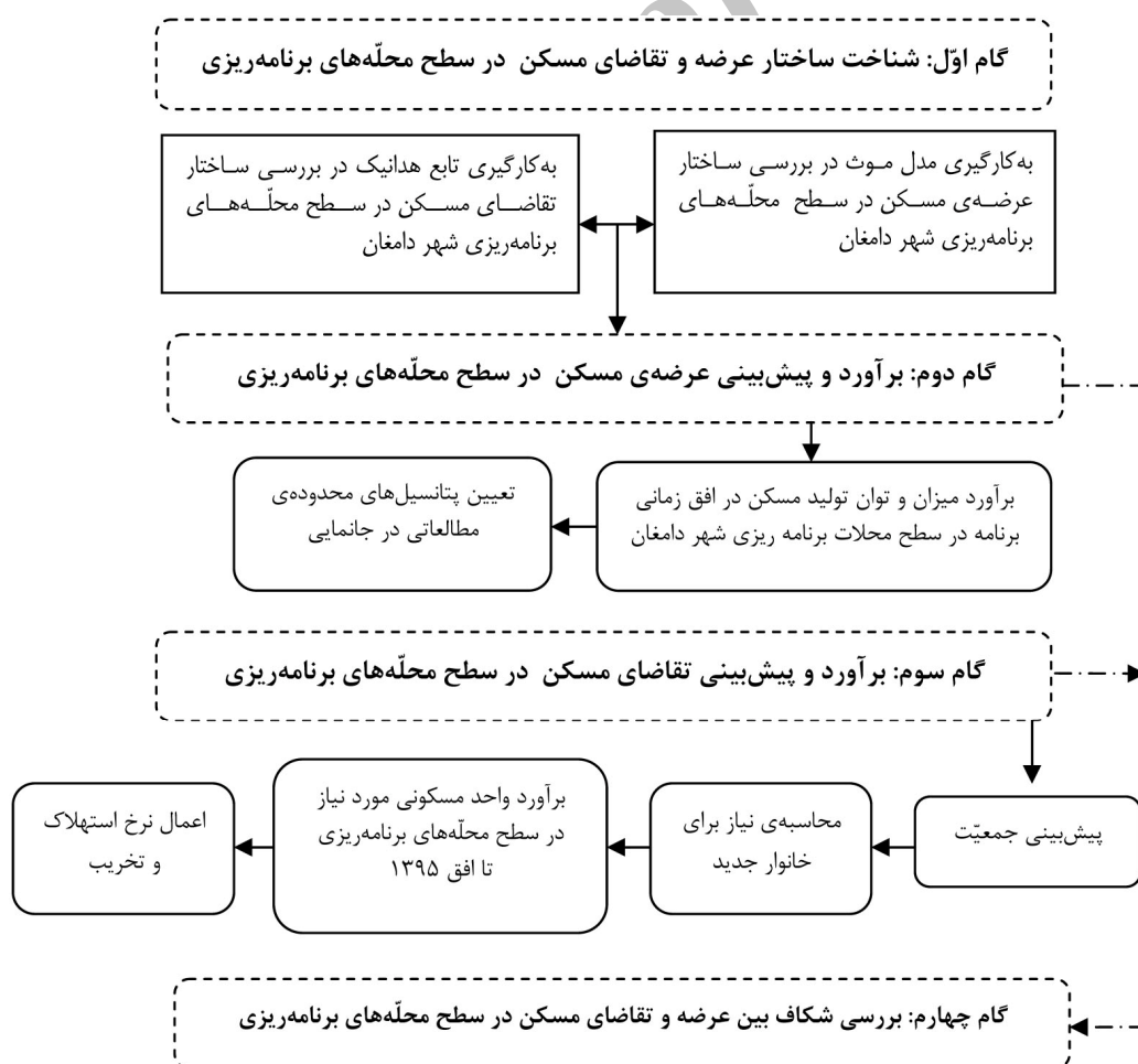
شکل ۳. فرآیند شناخت ساختار عرضه و تقاضای مسکن در سطح محله‌های برنامه‌ریزی شهر دامغان

در بحث اقتصاد مسکن، دو مفهوم عرضه و تقاضا در تعیین قیمت مسکن نقش به‌سزایی برعهده دارد. برآورد مطمئن از نیاز به مسکن، عامل مهمی در تدوین سیاست‌ها و تنظیم و ارزیابی برنامه‌های مسکن است. برای تنظیم و اجرای برنامه‌ها، باید نیاز مسکن را در مناطق مختلف شهر دامغان مشخص کرد و همچنین شناختی از ویژگی‌های اقتصادی و اجتماعی متقاضیان به دست آورد که این امر به تعیین اولویت‌های تهیه مسکن منجر خواهد شد. اولویت‌ها ممکن است بر مبنای کمبود مسکن، اهمیت مناطق معین، گروه‌های جمعیتی و هدف‌های برنامه‌های عمرانی تعیین شود. فرآیند روش کار در این بخش در شکل زیر ارائه شده است.