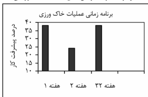
نمودار ۱- برنامه زمان‌بندی شده عملیات زراعی