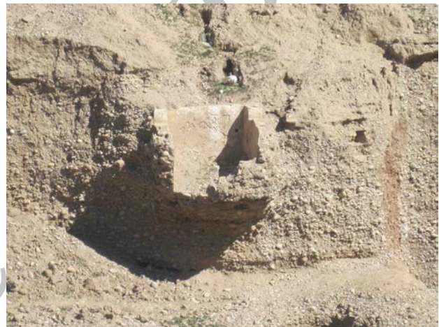
تصویر ۴. قسمتی از سقف فرو ریخته پل‌بند. Fig. 4. The collapsed roof of Polband.

تخریب قسمت‌های کناری پل مشخص نیست، با توجه به عرض پشت‌بندها احتمالاً حدود ۲ متر بوده است. ارتفاع پل کمی بیش از ۶ متر است. این پل دارای ۵ پایه بوده که ۳ تا در میان رودخانه و ۲ تا در قسمت حاشیه رودخانه قرار داشته که عرض پایه‌های پل مختلف و حدود ۳ متر است. پل، چهار چشمه با عرض‌های متفاوتی دارد؛ چشمه اول از راست حدود ۳/۴۵ متر، چشمه دوم ۳/۴۵ متر، چشمه سوم ۴/۲۵ متر و چشمه چهارم ۳/۳۰ متر عرض داشته‌اند. آنچه از ظاهر و سطح خارجی پایه پل آشکار است و شواهد پراکنده سنگ‌های نرمه تراش و گواهی ساکنان حاشیه پل، پایه پل توسط سنگ‌های نرمه تراش پوشیده شده بود که در حال حاضر اثری بر روی پل از این نوع سنگ مشاهده نمی‌شود و به نظر می‌رسد با ملات به پل متصل بوده‌اند. محل احداث پل در ابتدای احداث آن بایستی بسترسازی می‌شده و دونقطه ابتدایی و انتهایی آن خاک رسی و شنی است که سیلاب به آنجا آورده است. همچنین این پل