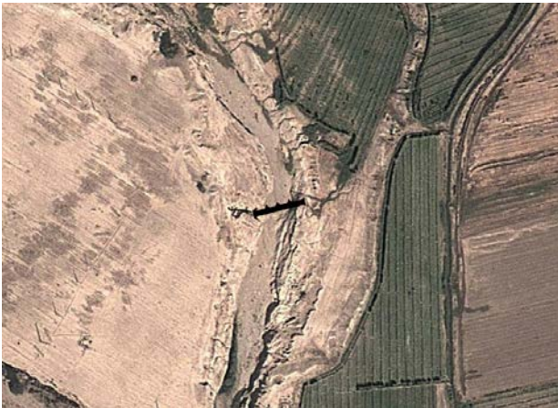
تصویر ۱. موقعیت پل.