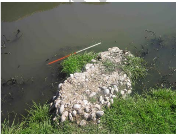
تصویر ۳. قسمتی از یکی از موج شکن‌های پل. عکس: حسن اکبری، ۱۳۹۲.