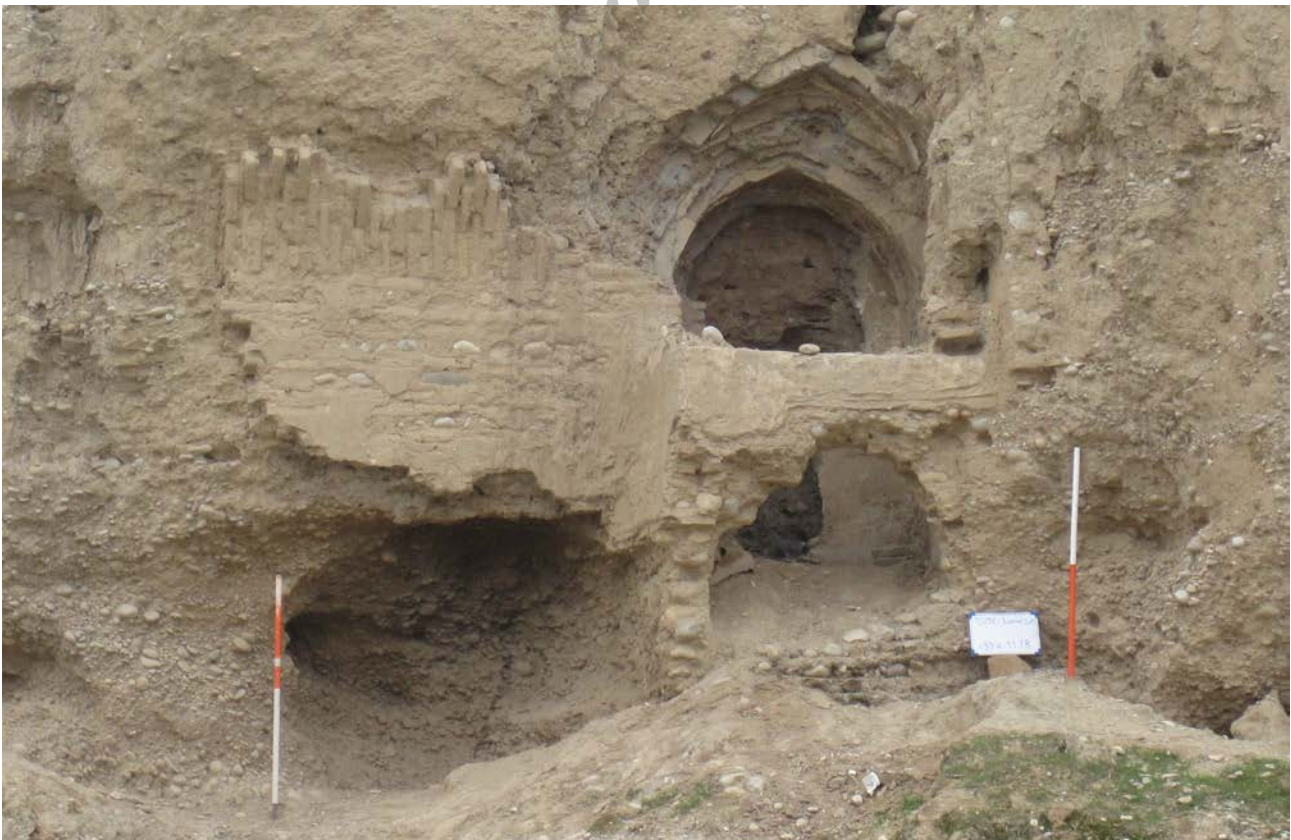
تصویر ۸. بقایای معماری دوره ایلخانی محوطه لور در نزدیکی پل بند. عکس: حسن اکبری، ۱۳۹۲. Fig. 8. Architectural remains of the Ilkhani Period near Loor Dam. Photo: Akbari, H., 2013.

شواهد تاریخ‌گذاری: در اطراف سازه مورد بحث تعدادی قطعات سفال به دست آمد که همگی آنها متعلق به دوره میانه یا متأخر اسلامی هستند. این سفال‌ها که بیشتر از نوع لعابدار با لعاب سبز و تعدادی بدون لعاب با نقش‌کنده هستند، متعلق به دوره اسلامی میانه (ایلخانی) اند، همچنین در فاصله ۵۰ متری پل آثار معماری