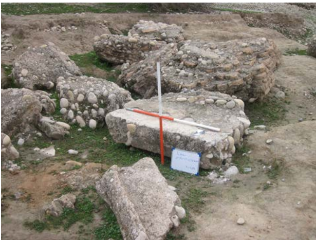
تصویر ۲. قسمتهایی از پاره دیوارهای پل بند.