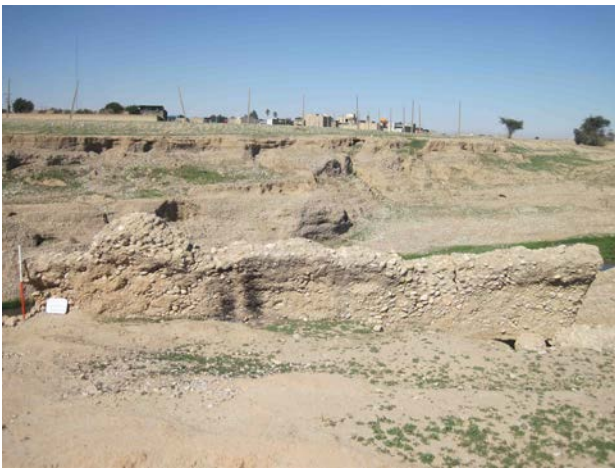
تصویر ۵. قسمتی از کانال انتقال پل‌بند. Fig. 5. Water conveyance channel.

لرستان و پل اسلامی دختر از دوره اسلامی ساخته شده است. بدین ترتیب که دورتادور پایه را با ماسه‌سنگ می‌چیدند و داخل آن را با قلوه سنگ و ملاط شفته آهک پر می‌کرده‌اند. مصالح پل عبارتند از ماسه سنگ، قلوه سنگ، سنگ تراشیده و آجر و ملات آن هم از آهک است که البته برای زود گرفتن ملات به آن اندکی گچ اضافه کرده‌اند. اندازه اجرها ۹*۲۸*۲۸ و قلوه سنگ‌ها درشت و قطر تقریبی آنها از ۱۰ سانتیمتر ۳۰ سانتی‌متر متغیر است. مصالح بومی و بر آورنده مقاومت در برابر نیروها بوده و در مقابل رطوبت و آب‌شستگی مقاوم هستند. همچنین با توجه به اینکه پل‌های تاریخی دارای وزن زیادی بوده و از طرفی فشار نیروی سیلاب نیز