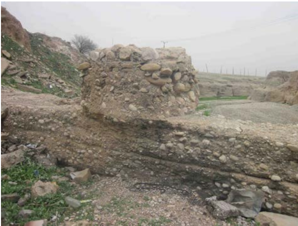
تصویر ۷. پاره دیواره‌های به جای مانده از پل بند. Fig. 7. Remaining Walls of Polband.

دوره ایلخانی به طور مشهود مشخص است و این مسئله بیشتر ثابت می‌کند که پل بند متعلق به دوره ایلخانی است (تصویر ۸).