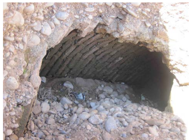
تصویر ۶. قسمتی از سازه‌های جانبی پل. Fig. 6. Accessory Structures.

تخریب قسمت‌های کناری پل مشخص نیست، با توجه به عرض پشت‌بندها احتمالاً حدود ۲ متر بوده است. ارتفاع پل کمی بیش از ۶ متر است. این پل دارای ۵ پایه بوده که ۳ تا در میان رودخانه و ۲ تا در قسمت حاشیه رودخانه قرار داشته که عرض پایه‌های پل مختلف و حدود ۳ متر است. پل، چهار چشمه با عرض‌های متفاوتی دارد؛ چشمه اول از راست حدود ۳/۴۵ متر، چشمه دوم ۳/۴۵ متر، چشمه سوم ۴/۲۵ متر و چشمه چهارم ۳/۳۰ متر عرض داشته‌اند. آنچه از ظاهر و سطح خارجی پایه پل آشکار است و شواهد پراکنده سنگ‌های نرمه تراش و گواهی ساکنان حاشیه پل، پایه پل توسط سنگ‌های نرمه تراش پوشیده شده بود که در حال حاضر اثری بر روی پل از این نوع سنگ مشاهده نمی‌شود و به نظر می‌رسد با ملات به پل متصل بوده‌اند. محل احداث پل در ابتدای احداث آن بایستی بسترسازی می‌شده و دونقطه ابتدایی و انتهایی آن خاک رسی و شنی است که سیلاب به آنجا آورده است. همچنین این پل