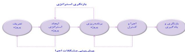
شکل ۲- فرآیند مدیریت راهبردی پروژه [۱۸]

در این مدل تأکید بر این است که مدیریت پروژه شاید نیاز به تعریف دوباره پروژه یا بازنگری مجدد راهبرد پروژه داشته باشد. همچنین در مرحله برنامه ریزی یا حتی زودتر، باید مشکلات اجرا پیش بینی شود.