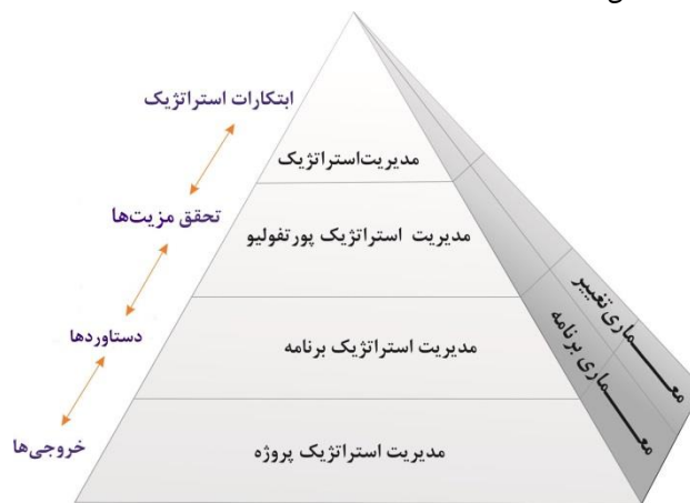
شکل ۵- ارتباط بین مدیریت راهبردی و پروژه در سازمان [۷]

وضعیت پروژه‌های مختلف ارائه نماید و پروژه‌هایی را که پتانسیل بالا برای موفقیت دارند و پروژه‌هایی که ارزشی برای اهداف راهبردی شرکت ندارند را مشخص کند [۳۵].