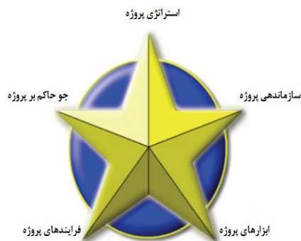
شکل ۴- مدل رهبری راهبرد پروژه [۱۷]

شماره (۲۰۱۲) مدل رهبری راهبردی پروژه ۳ را ارائه می‌دهد. این مدل جنبه‌های راهبردی، مرتبط با کسب‌وکار و همچنین جنبه‌های عملیاتی پروژه‌ها و رهبری به معنای انگیزش و الهام‌بخشی تیم پروژه را ترکیب می‌کند. به عقیده شنهار مدیریت پروژه فراتر از ابزارها یا فرآیندها است. مدیریت پروژه علاوه بر اینکه شامل ابزار و فرآیند می‌باشد، توجه افراد را به سوی سطوح بالاتری از آگاهی هدایت می‌کند که تأثیر اساسی بر روی عملکرد پروژه دارد [۲۹]. این مدل شامل پنج مؤلفه به شرح زیر می‌باشد: راهبرد پروژه، جو حاکم بر پروژه ۴ ، سازماندهی پروژه ۵ ، فرآیندهای پروژه ۶ و ابزارهای پروژه ۷ (شکل ۴).