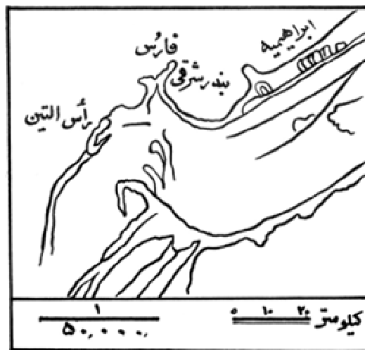
نقشه محل آینه اسکندر (فرهنگ معین، ج ۵، ص ۷۲)

و... من آن محلی را که گمان دارند آینه در آن بوده جستجو کردم، و نه آن محلی را یافتم و نه اثری از آن را... (یاقوت حموی ۱۳۷۶: ۱/ ۱۸۷).