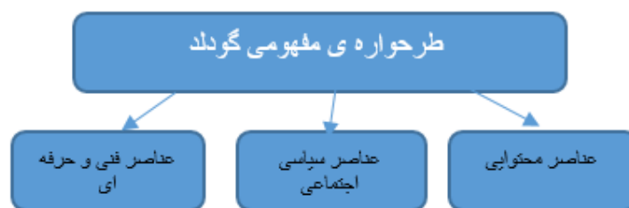
شکل (۲). طرحواره مفهومی برنامه درسی

دانشهای حرفه‌ای سودمندند. این عناصر به عنوان اجزای مکمل عناصر تمامی حیطه‌ها شناخته می‌شوند (شورت، ۱۳۸۸: ۲۸۱). طبق شکل (۲) جهت طراحی برنامه درسی مبتنی بر اقتصاد مقاومتی عناصر سازنده طرحواره مفهومی گودلد به عنوان مدل پیشینی مورد نظر قرار گرفت.