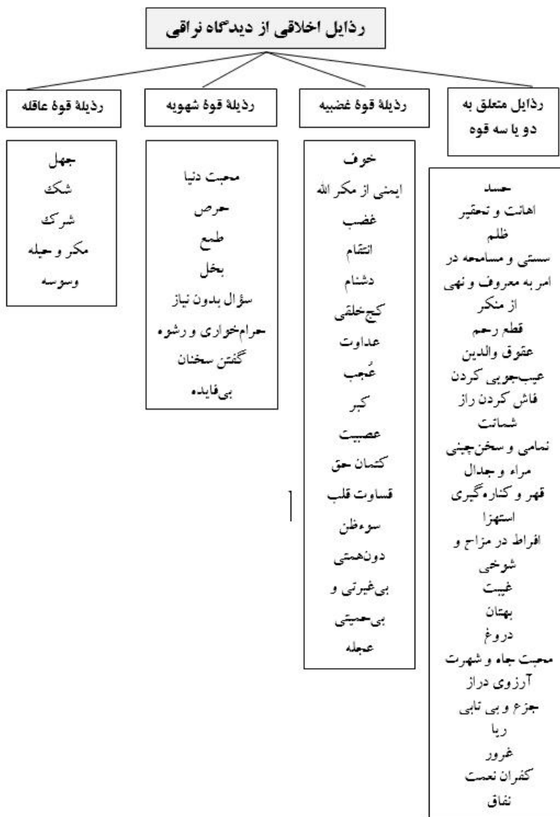
جدول ۱. رذایل اخلاقی از دیدگاه نراقی (نراقی، ۱۳۸۸)