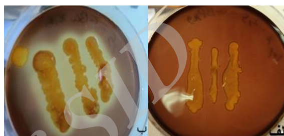
معرف یدید- یدید پتاسیم

شکل ۱- الف. نمونه شاهد: نبود هاله پس از افزودن معرف یدید- یدید پتاسیم، ب. نمونه مثبت: وجود هاله شفاف پس از افزودن