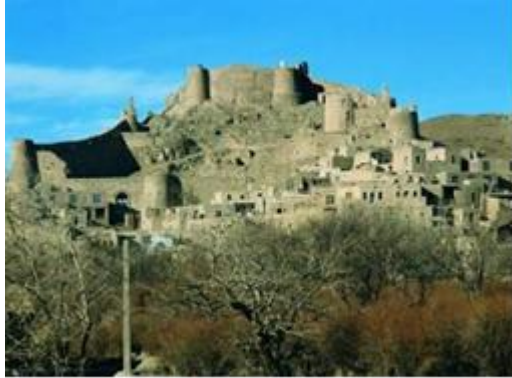
تصویر شماره ۷: قلعه فورگ