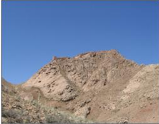
تصویر شماره ۵: نمایی از قلعه قاین