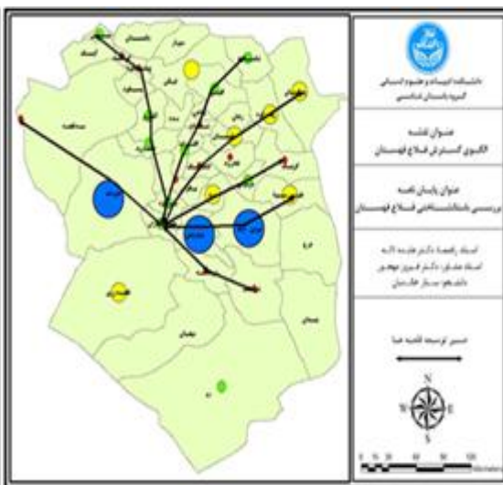
تصویر شماره ۱۰: الگوی گسترش قلعه قهستان