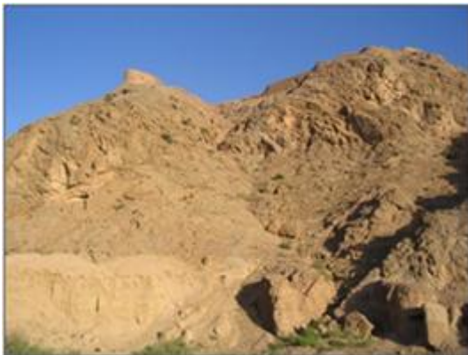
تصویر شماره ۳: نمایی از قلعه حسن آباد