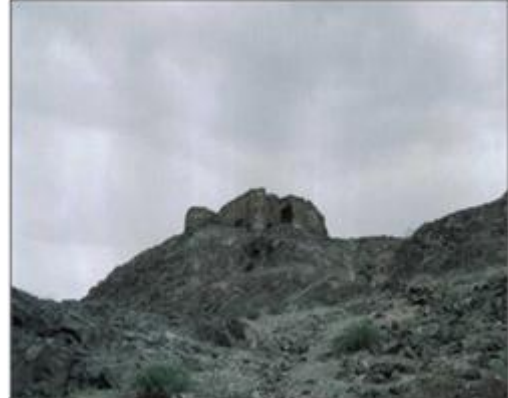
تصویر شماره ۴: نمایی از قلعه زری