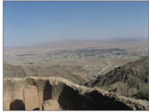
تصویر شماره ۶: نمایی از شهر بیرجند از بالای قلعه غلام کش