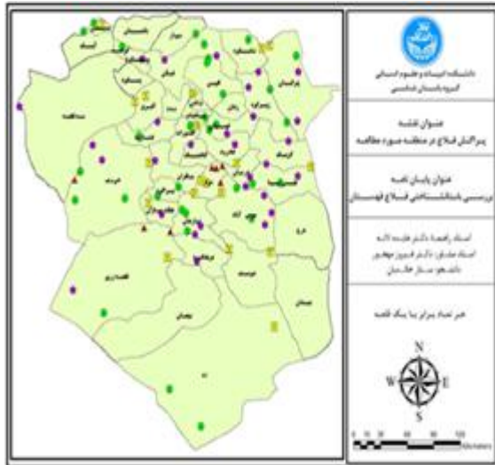
تصویر شماره ۹: پراکنش قلعه در منطقه مورد مطالعه