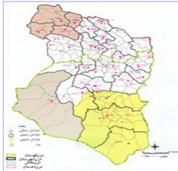
نقشه شماره ۱: موقعیت قرارگیری قهستان در نقشه تقسیمات کشور