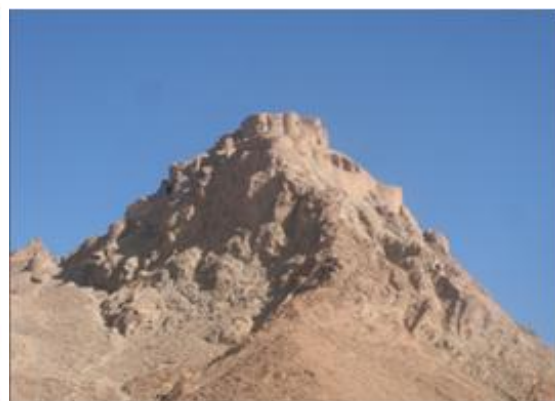
تصویر شماره ۲: نمایی از قلعه رقه