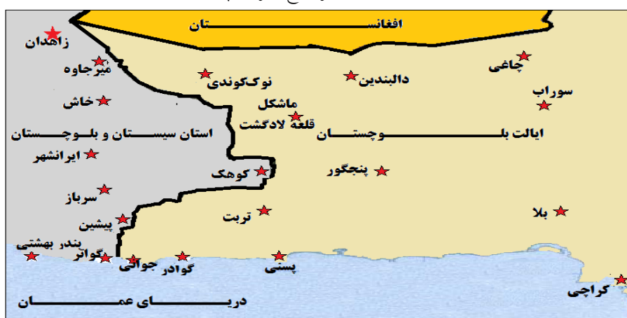
نقشه شماره ۱. مناطق مرزی ج.ا. ایران و پاکستان

مرز ایران و پاکستان از ملک‌سیاه‌کوه شروع می‌شود و از مشرق رباط، میرجاوه و خاش عبور می‌کند و به رود تالاب متصل می‌شود. سپس از شمال و مشرق کنده گزشته و به سیاه‌کوه می‌رسد و از آنجا تا مقابل تپهٔ کورکیان به سمت جنوب امتداد می‌یابد و با رود ماشکل تلاقی می‌کند. از آنجا در مسیر رودخانه به سمت غرب می‌رود، سپس با گذر از عرض رودخانه در شرق بندر گواتر به دریای عمان منتهی می‌شود (حافظ‌نیا، ۱۳۸۱: ۳۰۹).