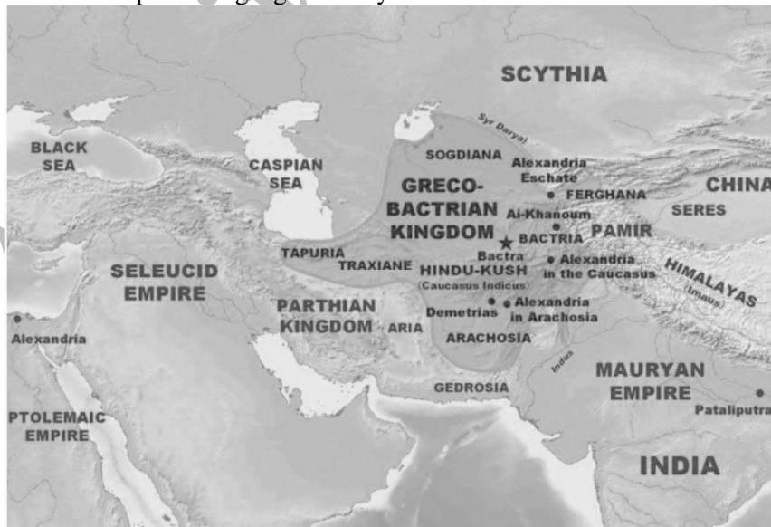
تصویر ۲: نقشه موقعیت امپراطوری بلخ

http://www.geugo.l.u-tokyo.ac.JP/hkum/bactrian.html