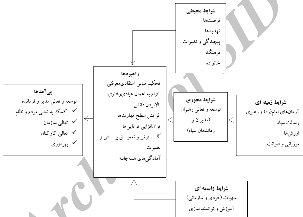
نمودار ۲. الگوی پارادایمی توسعه و تعالی مدیران و فرماندهان سپاه (نگارنده، ۱۳۸۹)