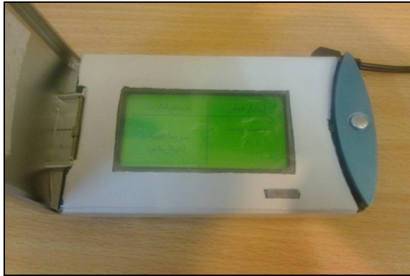
شکل ۵: نمونه‌ای از نتایج نهایی ارزیابی پوسچر به روش RULA

سیستم ۶/۲ \pm ۸۴/۲ بدست آمد که بر اساس مقیاس طبقه‌بندی در رتبه B و محدوده قابل قبول و وضعیت خیلی خوب قرار گرفت. جهت تعیین پایایی نیز آلفای کرونباخ محاسبه شد و مقدار آن ۰/۷۱۶ بدست آمد. همچنین ضریب همبستگی پیرسون بین امتیاز کل دو بار پر کردن پرسشنامه توسط کارشناسان بهداشت حرفه‌ای، برابر ۰/۸۸۸ بدست آمد ( P < ۰/۰۰۱ ).