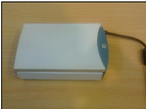
شکل ۳: تصویر PDA

تصویر دستیار دیجیتال شخصی ساخته شده در شکل ۳ آمده است. وزن این سیستم ۳۰۰ گرم و دارای ابعاد ۱۳×۸×۳/۵ سانتی‌متر می‌باشد.