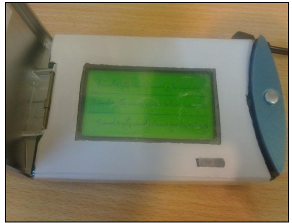
شکل ۴: نمونه‌ای از سوالات ارزیابی پوسچر به روش RULA

در این سیستم ورود داده‌ها توسط فرد ارزیابی کننده با استفاده از صفحه لمسی انجام می‌شود. نمونه‌ای از سوالات در شکل ۴ آمده است.