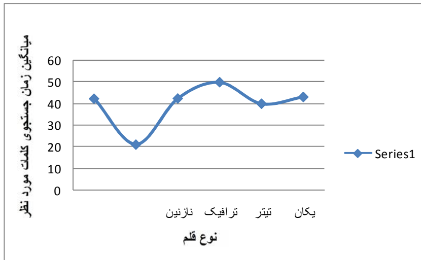
شکل ۲- میانگین زمان جستجوی کلمات مورد نظر