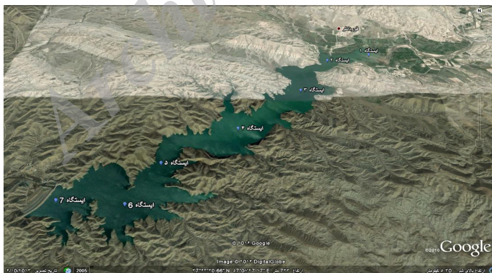
شکل ۱: موقعیت ایستگاه‌های نمونه برداری

در این مطالعه که یک بررسی توصیفی مقطعی - تحلیلی می‌باشد در ابتدا تعداد و موقعیت ایستگاه‌های مورد مطالعه با توجه به موقعیت جغرافیایی، شکل و مساحت مخزن، عمق آب در قسمت‌های مختلف، چگونگی آبیگری از سد، آبهای ورودی به دریاچه، آبیگرهای سد و با در نظر گرفتن منابع تولید آلاینده منطقه انتخاب گردید، بر این اساس تعداد ایستگاه‌های اندازه‌گیری ۷ محل انتخاب شد (شکل ۱) که محل ایستگاه شماره ۱ در منطقه ورود آب رودخانه‌های شیرین دره به داخل مخزن سد، یک ایستگاه در خروجی آب سد (آبیگر سد) و ۵ ایستگاه بعدی را با توجه به نقشه دریاچه و مساحت مخزن که در حداکثر تراز آب ۱۷۵ هکتار می‌باشد، تعیین گردید، بدین صورت که مخزن با توجه به داشتن طول هفت کیلومتر به هفت قسمت در طول تقسیم شد و محل‌های نمونه‌گیری در مرکز دریاچه به فاصله یک کیلومتر از یکدیگر جهت نمونه