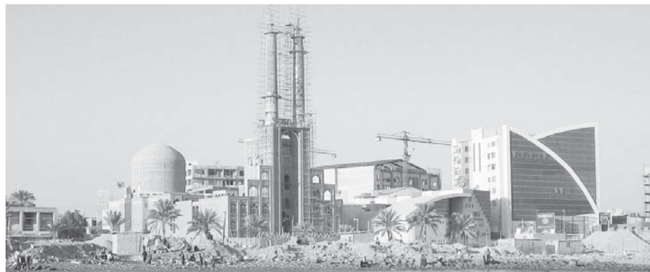
تصویر ۳. سبک‌های متفاوت و همجواری ناسازگار معماری در ساحل بندرعباس؛ ماخذ: نگارندگان، آذر ۱۳۸۹.