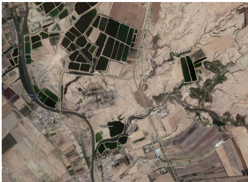
شکل ۱: موقعیت رودخانه گرگر در منطقه.

(power Ahvaz, 2004). این رودخانه ضمن تأمین آب شرب شهرستان شوشتر، هفتگل، بخشی از رامهرمز و روستاهای آن، در زمره یکی از قطب‌های بزرگ پرورش ماهی استان بشمار می‌آید (Jafari Tabard et al. , 2007). به‌گونه‌ای که حدود ۱۵۰۰ حوضچه پرورش ماهی در اطراف این رودخانه با وسعت حدوداً ۱۵۰۰ هکتار، آب مصرفی خود را از آن تأمین می‌نمایند. همچنین از آب این رودخانه برای سایر مصارف مانند کشتارگاه شوشتر و تصفیه‌خانه سید حسن استفاده می‌شود. از این رو این رودخانه برای بسیاری از سازمان‌ها و نهادها مانند شیلات، وزارت نیرو، جهاد کشاورزی، آب و فاضلاب و مردم منطقه از اهمیت خاصی برخوردار است (Jafarzadeh, 2006). محدوده مطالعات شامل مسیر رودخانه در فاصله بند میزان در شوشتر تا بند قیر می‌باشد.