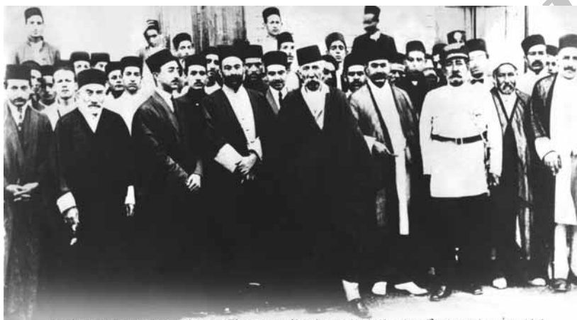
اعضای هیات دولت و نمایندگان مجلس شورای ملی در مراسم افتتاح مدرسه فلاحیت و منابع روستایی در سال ۱۳۰۴ شمسی تهران، باغ سبزیکاری امین الملک

از سمت راست: نقر پنجم میرزا یوسف خان مستوفی (نخست وزیر وقت) ملقب به مستوفی الممالک و در دو طرف وی ارتشبد محمود جم و محمد علی فروغی دیده می شود. نقر هفتم میرزا محمود خان فاتح (مدیر مدرسه عالی فلاحیت). دوره آموزشی در این مدرسه شامل دوسال در تهران و یکسال در کرج (عملیات کشاورزی) بوده است.