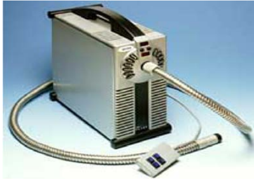
شکل شماره ۲:

دستگاه PL500 که دارای طیفهای مختلف نوری بوده و برای جستجو مایعات و آثار مختلف در صحنه جرم از آن استفاده می شود.