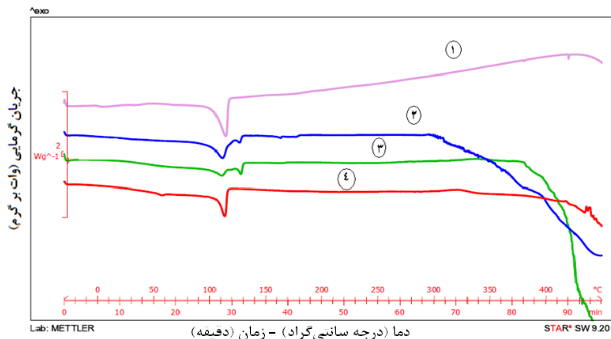
شکل ۲- منحنی‌های DSC چندسازه‌های مورد مطالعه

(۱- LDPE خالص، ۲- خمیر کاه رنگ‌بری شده، ۳- پودر کاه رنگ‌بری شده و ۴- پودر کاه بدون رنگ‌بری)