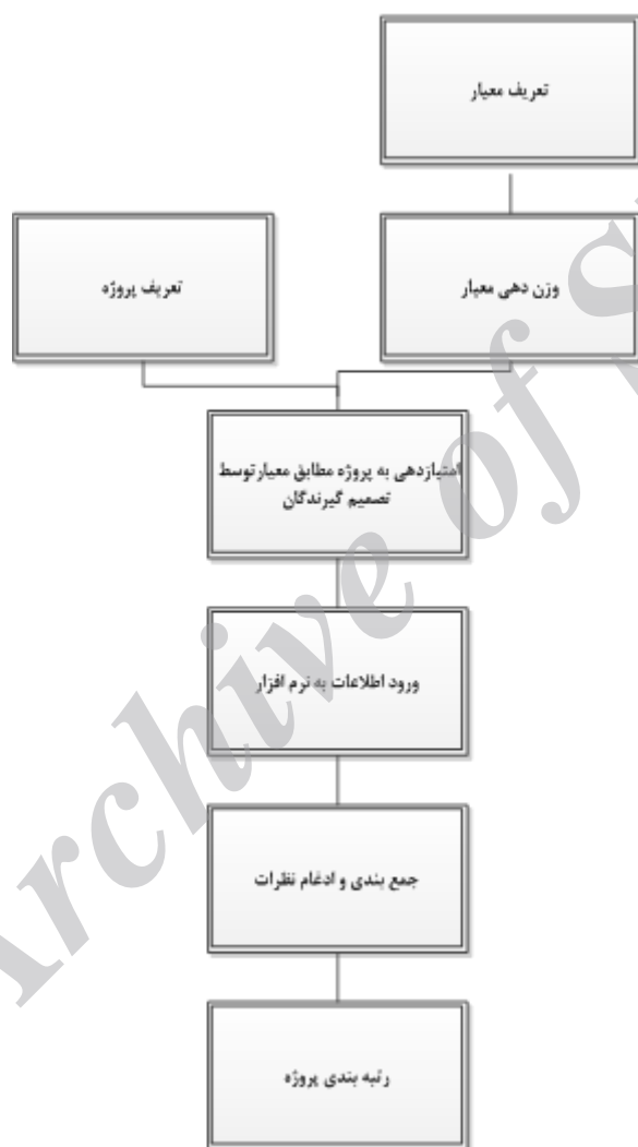
شکل ۲- فلوچارت رتبه‌بندی پروژه‌ها

فلوچارت روش استفاده شده برای رتبه‌بندی پروژه‌ها در این شرکت در شکل شماره ۲ نشان داده شده است.