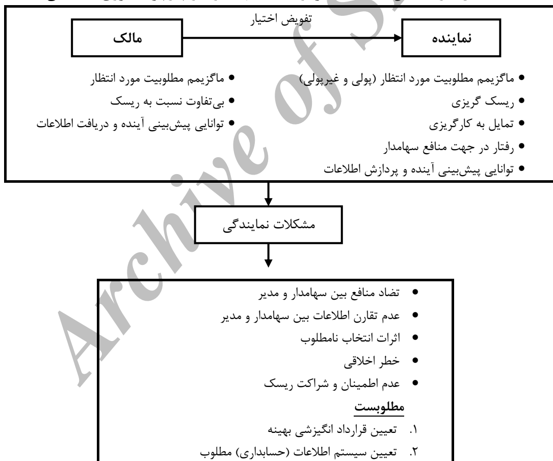
شکل ۱. رابطه بین نماینده (مدیر) و مالک (سهامدار) در چارچوب تئوری نمایندگی

شکل ۱ رابطه بین نماینده (مدیر) و مالک (سهامدار) را در چارچوب تئوری نمایندگی نشان می‌دهد. نظریه نمایندگی، مبتنی بر فرض‌های مختلفی از جمله فرض‌های رفتاری مشخص بین سهامدار و مدیر است و می‌توان آنها را به صورت زیر خلاصه کرد: